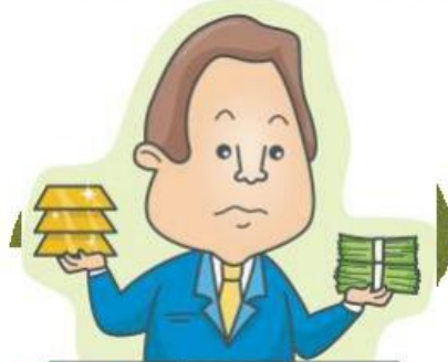
Прибыль от фирмы