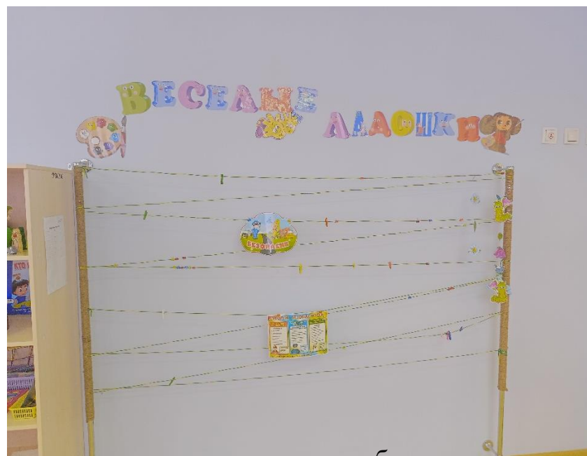
стенд для детских работ

Ребёнок может разместить свой рисунок, чтобы воспитатель и остальные ребята на него любовались.