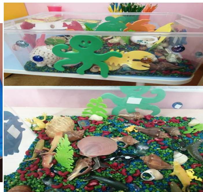
Аквариум с морскими обитателями

Можно использовать в занятиях по сенсорному воспитанию, по познавательному развитию, развитию мелкой моторики. Дети могут передвигать рыбок с помощью пробок.