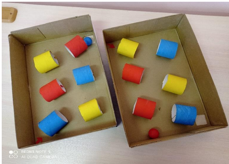
Д/И: «ПРОЙДИ ЛАБИРИНТ»