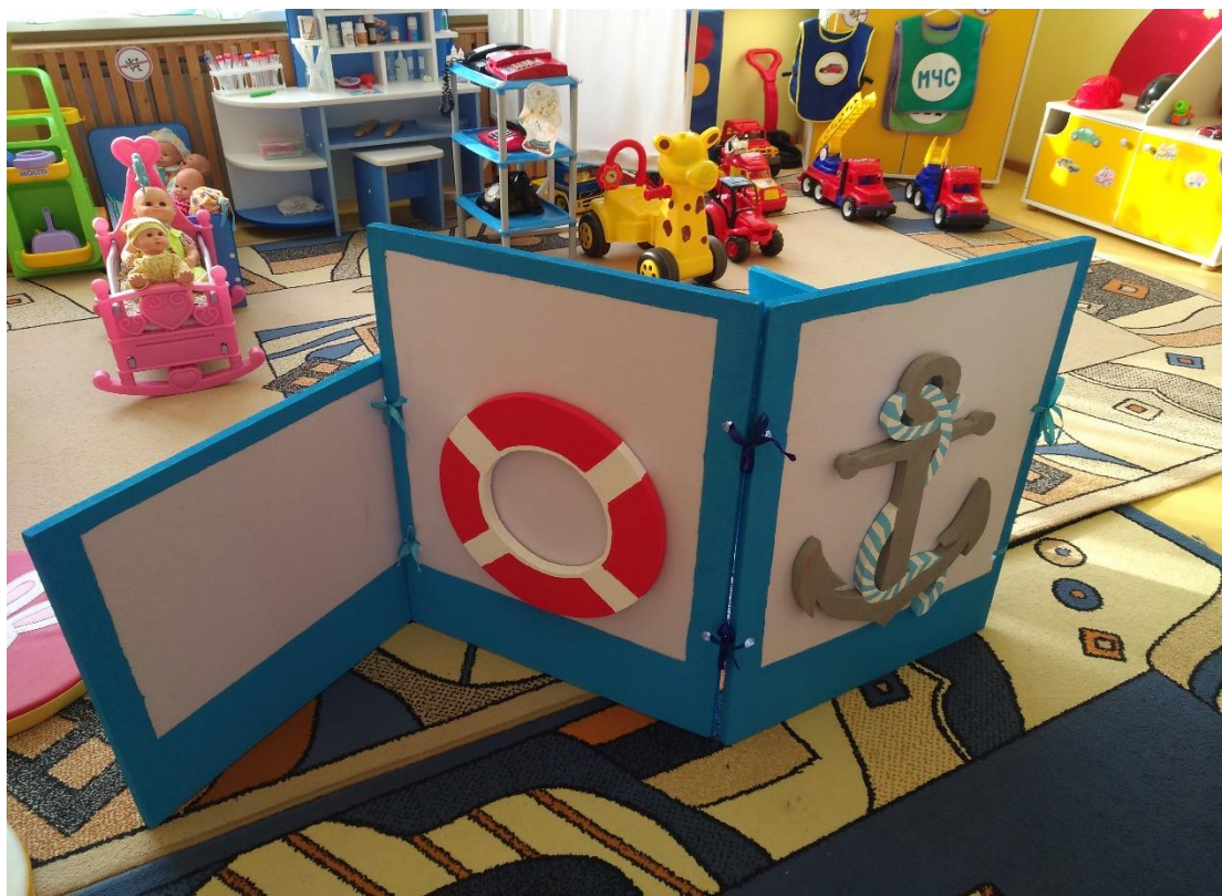
«КОРАБЛЬ ТРАНСФОРМИРУЕМЫЙ В АВТОМОБИЛЬ»