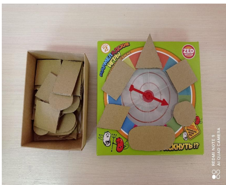
Д/И: «ОТГАДАЙ ФИГУРУ»