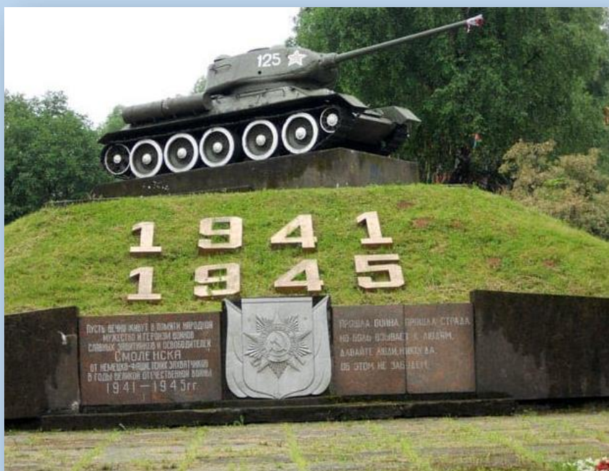
Мемориал Великой Отечественной войны

В самом городе-герое Смоленске было сформировано три истребительных батальона и один батальон милиции. Активно помогали советским бойцам и его жители, они рыли противотанковые рвы и окопы, сооружали взлетные площадки, строили баррикады и ухаживали за ранеными. Несмотря на героические усилия защитников Смоленска, 29 июля 1941 г. гитлеровцам удалось войти в город. Оккупация продлилась до 25 сентября 1943 г, но и в течение этих страшных для Смоленска лет, его жители продолжали бороться с врагом, создавая партизанские отряды и ведя подпольную подрывную деятельность.