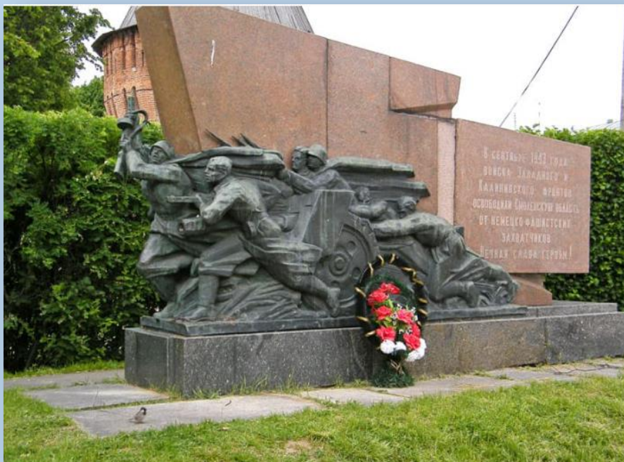
Мемориал - Музей - Смоленщина в годы Великой Отечественной Войны

В честь освобождения смоленской земли, в 1974 г, в центре города-героя Смоленска (башня Громово), был установлен Мемориальный знак из красного гранита. На нем изображен меняющий огневую позицию артиллерийский расчет.