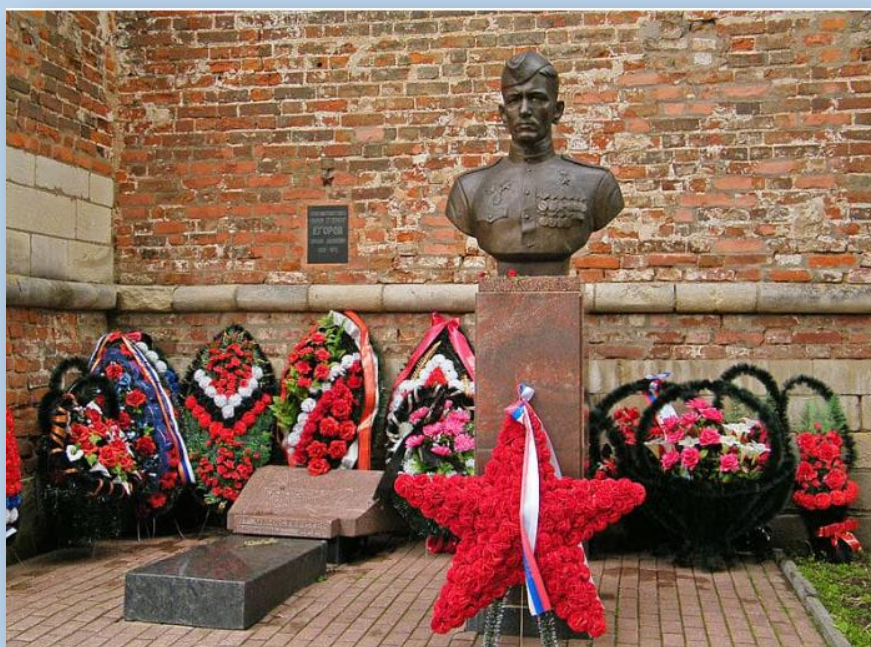
Памятник М. Егорову, водрузившему вместе с сержантом Кантария Знамя Победы на крыше

В числе знаменитых героев Смоленска сержант М.А. Егоров, который вместе с двумя другими красноармейцами водрузил знамя Победы над берлинским рейхстагом. Могила М. Егорову находится у крепостной стены города, в 2000 г. на ней был установлен бюст героя.