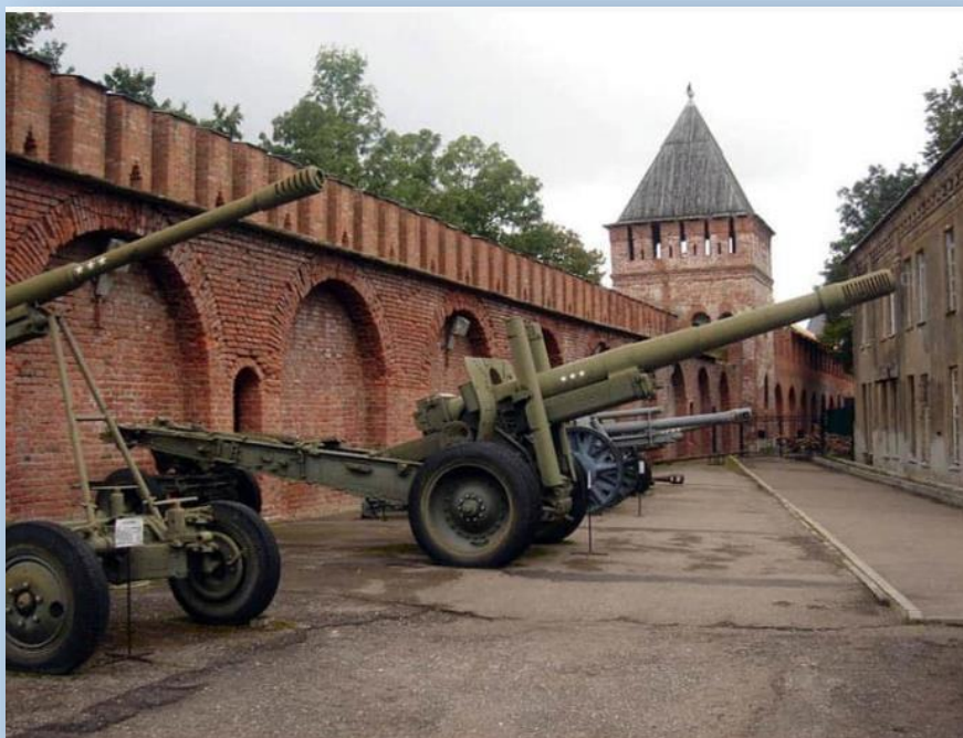
Мемориал - Музей - Смоленщина в годы Великой Отечественной Войны

В числе знаменитых героев Смоленска сержант М.А. Егоров, который вместе с двумя другими красноармейцами водрузил знамя Победы над берлинским рейхстагом. Могила М. Егорову находится у крепостной стены города, в 2000 г. на ней был установлен бюст героя.