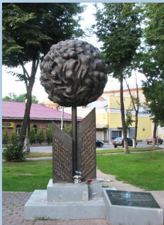
Памятник детям - жертвам концлагерей

крепостной стены в Смоленске, где горит Вечный огонь. 9 мая 1966 года в сквере его имени установлен памятник Владимиру Куриленко в виде фигуры героя с гранатой в руке.